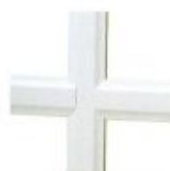
blanc 26 mm