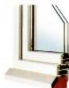
dormant pour pose en rénovation