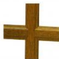
ton chêne doré 2 faces existe en d'autres teintes

Un large choix de petits bois qui peuvent être intégrés ou rapportés.