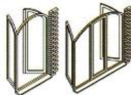
Fenêtres cintrées ouverture à la française 2 et 3 vantaux