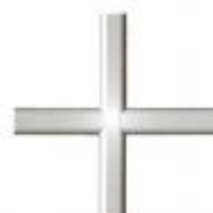
blanc rapporté deceuninck