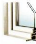
dormant système monobloc pour pose en neuf