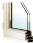
dormant pour fenêtre standard