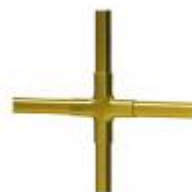
laiton avec croisillons